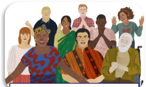
“Anabaptists Now,” por Dona Park, de Believing and Belonging